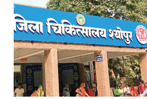
जिला अस्पताल में अब जनरल मरीजों की सोनोग्राफी जांच होना बंद हो गई है।

मेडिकल कॉलेज शुभपुर में पदस्थ रेडियोलॉजिस्ट जिला अस्पताल में अपनी सेवाएं देने के लिए क्यों नहीं पहुंचे, इसका कारण तो फिलहाल पता नहीं है, लेकिन उनके नहीं पहुंचने से जिला अस्पताल में अभी तक सभी मरीजों को मिल रहा सोनोग्राफी जांच की सुविधा का लाभ अब मिलना पूरी तरह बंद होना तय दिख रहा है। वहीं