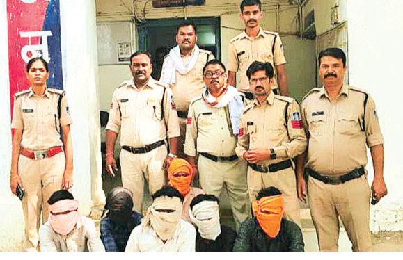
पुलिस ने दूल्हे के पिता और मामा पक्ष के 5 लोगों पर दर्ज किया केस